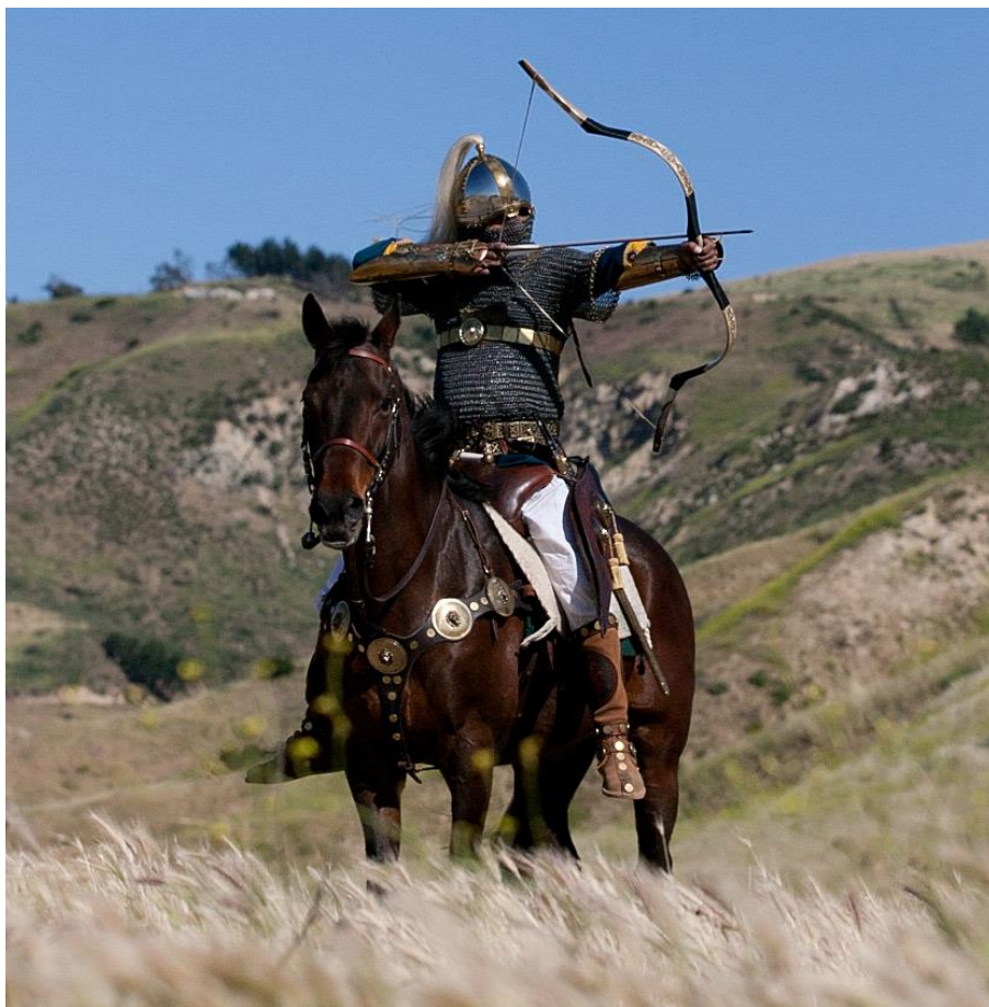
Рисунок 5. Реконструкция конного лучника - сасанида